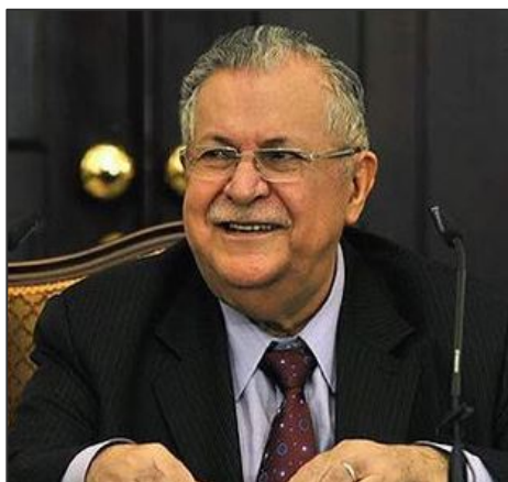
Jalal Talabani Presidente de Iraq Fundador y Secretario General del PUK, Iraq Presidente Honorario de la IS 12 de noviembre de 1933 - 3 de octubre de 2017