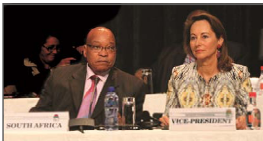
Presidente de Sudáfrica S.E. Jacob Zuma y Ségolène Royal, PS, Francia

El Congreso escuchó seguidamente una contribución de Ségolène Royal, Vicepresidenta de la IS (PS, Francia). Otros discursos fueron pronunciados por Trevor Manuel, Ministro de Planificación de Sudáfrica; Kemal Kılıçdaroğlu, líder del CHP Turquía; Alfred Gusenbauer, Vicepresidente de la IS (SPÖ, Austria); Sergei