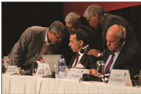
Enmiendas a resoluciones

La situación en Sahara Occidental también ocupó su lugar entre los temas abordados en la resolución, reflejando el involucramiento de la Internacional en la búsqueda de una solución justa, pacífica y duradera a este conflicto. Otros temas también incluidos en la resolución fueron la situación en Chipre y el conflicto de Malvinas/Falklands.