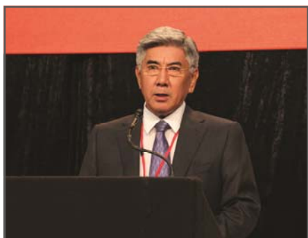
Zharmakhan Tuyakbay, OSDP Kazajstán

El Congreso reafirmó la necesidad de priorizar una posición de solidaridad al enfrentar desafíos tales como las consecuencias de la crisis financiera, la profundización de las desigualdades globales y el abuso a los derechos y libertades humanos en regiones del mundo. Un Nuevo Internacionalismo y una Nueva Cultura de Solidaridad, en conclusión, constituyen juntos el pilar central no sólo para encontrar