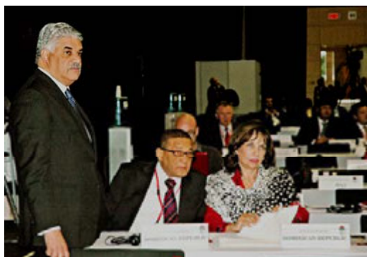
PRD, República Dominicana

Las contribuciones enfatizaron que un renovado internacionalismo debería asegurar un cambio progresista, difundir la democracia, aumentar la seguridad cooperativa, compartir las cargas colectivas y reforzar las instituciones internacionales democráticas. Al hacer un llamamiento a una mayor gobernanza mundial se enfatizó no solamente que organizaciones tales como el FMI, el Banco Mundial y la Organización Mundial del Comercio necesitaban reforzarse, sino que existía también la necesidad de reformas sociales y culturales. La necesidad de avanzar un nuevo internacionalismo permitirá sistemas políticos más responsables, más democracia y más libertad para los pueblos, como fue subrayado por el ex Primer Ministro Keita, o la necesidad de más política exterior y menos asuntos exteriores, como fue puesto de relieve por Ribeiro.