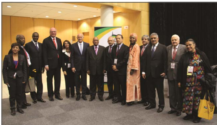
Nuevos miembros electos del Presidium

Treinta y tres Vicepresidentes fueron elegidos por papeletas de votación que incluían candidatos de todas las regions por medio de un sistema que aseguró una justa representación geográfica, asegurando también el equilibrio de género como se estipula en los Estatutos. La lista de los elegidos que conforman ahora a el Nuevo Presidium de la organización se puede encontrar en la página 44. El Congreso mandató al próximo Consejo elegir a tres Vicepresidentes para los restantes tres cargos vacantes en el Presidium.