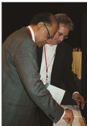
Navinchandra Ramgoolam, Primer Ministro de Mauricio

Siguiendo las decisiones tomadas por el Consejo en la reunión de enero de 2012 en San José, Costa Rica, la votación sería formal, competitiva y abierta a todos los miembros plenos de la Internacional Socialista que hubieran cumplido con los requerimientos estatutarios. Los candidatos registrados serían además elegidos por votación secreta.