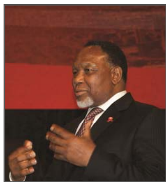
Vicepresidente de Sudáfrica Kgalema Motlanthe