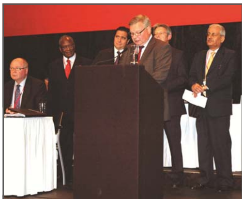
Comisión Electoral, anunciando los resultados