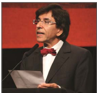
Elio Di Rupo, Primer Ministro de Bélgica

Se dio comienzo al primer tema principal del Congreso con una significativa intervención sobre el estado de la economía global por parte de Elio Di Rupo, Primer Ministro de Bélgica y Vicepresidente de la IS. Di Rupo explicó que hemos perdido el control del sistema financiero, lo cual causa un gran daño a la economía real. Además, expresó, esto ocurre con una total impunidad. Los mercados de valores son capaces de destruir negocios y eliminar empleos en cosa de segundos y sin supervisión el sector financiero radica en una especulación