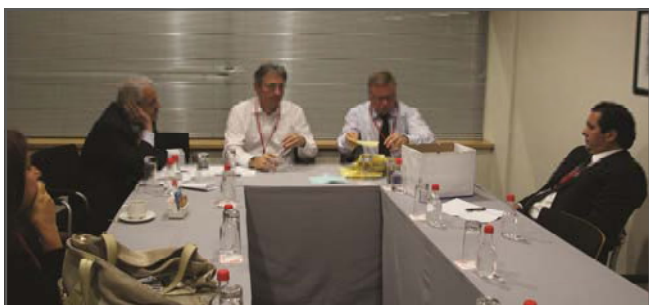
Comisión Electoral, recuento de votos

La elección del Presidente de la IS se realizó en primer lugar. El Presidente George Papandreou, único candidato, fue reelecto unánimemente con una votación a mano alzada, elección que él aceptó agradecido.