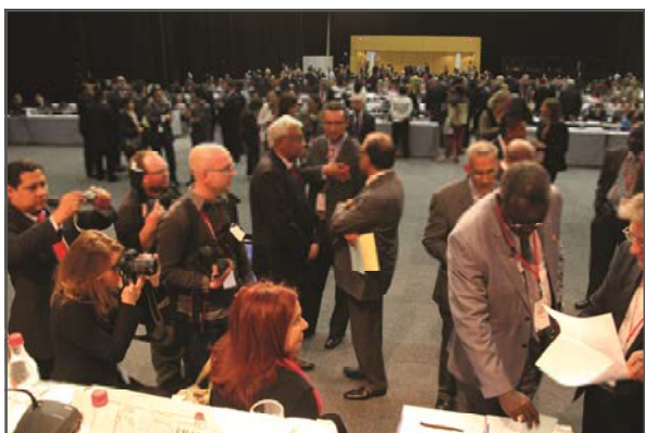
Votan los delegados