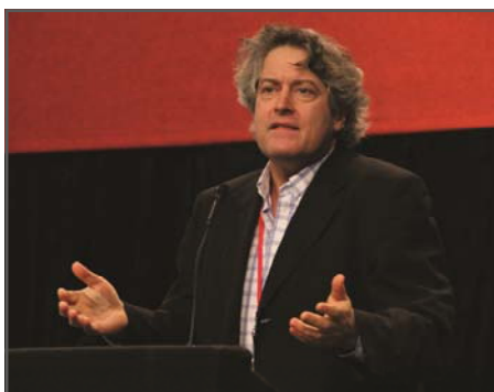
Rafael Michelini, Nuevo Espacio, Uruguay

soluciones a los problemas de hoy, sino también para promover nuevas oportunidades y desarrollos para todos los países. En resumen, este nuevo internacionalismo y esta nueva cultura de solidaridad constituyen ambos el camino y el requerimiento para lograr una sociedad global justa de derechos y libertades para todos.