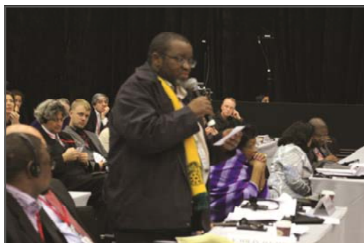
Gwede Mantashe, ANC, Sudáfrica