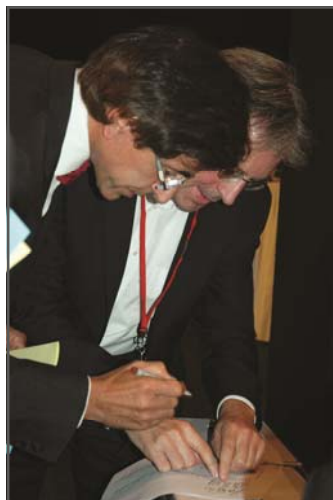
Primer Ministro Elio Di Rupo