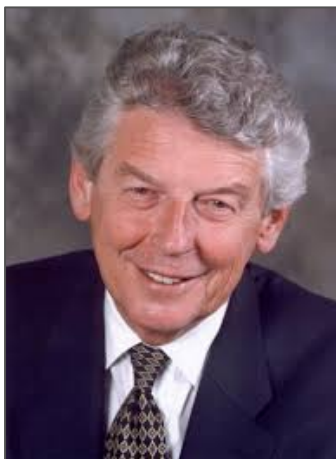
Wim Kok Ex Primer Ministro de los Países Bajos y ex Vicepresidente de la International Socialista