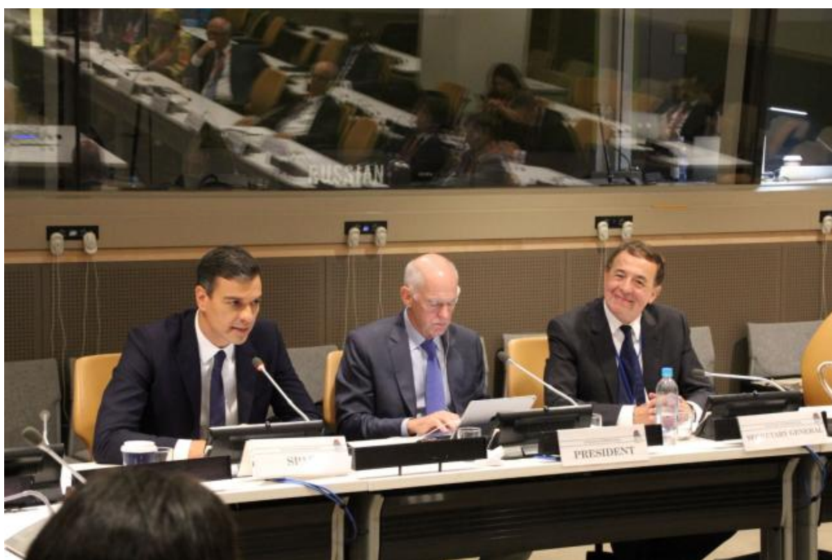
Pedro Sanchez, George Papandreou, Luis Ayala

El Presidium de la Internacional Socialista celebró su reunión anual en el marco del segmento de alto nivel de la Asamblea General de la ONU en la sede de las Naciones Unidas en Nueva York el 27 de septiembre de 2018. Miembros del Presidium, junto a Jefes de Estado y de Gobierno invitados y a un número de ministros de partidos miembros de la IS, centraron sus intercambios en los actuales temas claves para el movimiento socialdemócrata. La agenda de la reunión incluyó la existente situación internacional y los desafíos globales que se presentan al movimiento socialdemócrata; énfasis y prioridades para asegurar que el sistema multilateral asegure efectivamente la paz y la sostenibilidad y el respeto a las libertades y derechos de todos; y cómo reforzar los fundamentos de nuestra sociedad global en estos difíciles momentos.