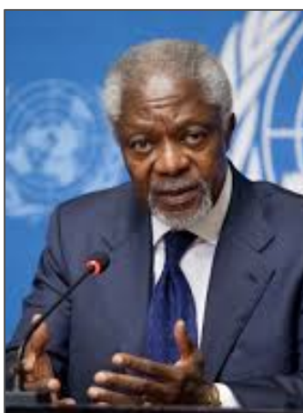
Kofi Annan Secretario General de las Naciones Unidas, 1997 – 2006