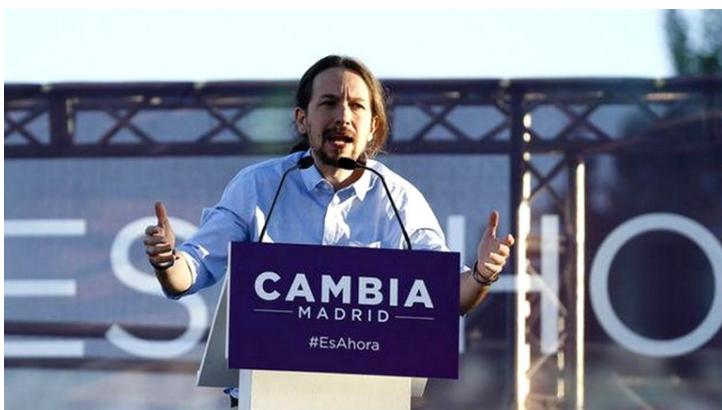
Pablo Iglesias, de Podemos: "No me gusta que se condene a alguien por